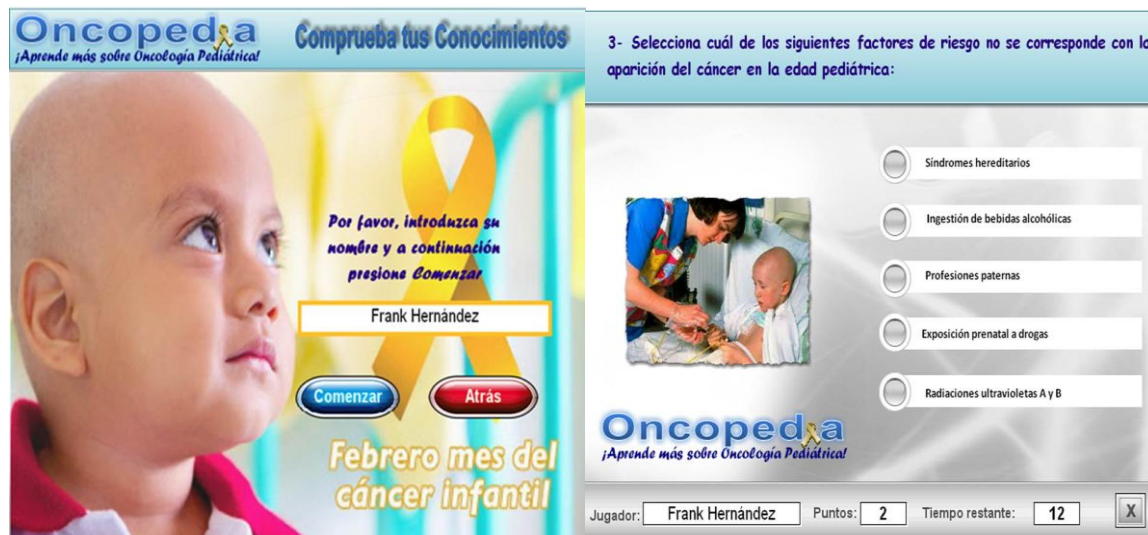
Figura 3. Módulo Comprueba tus conocimientos del software educativo "Oncopedia".