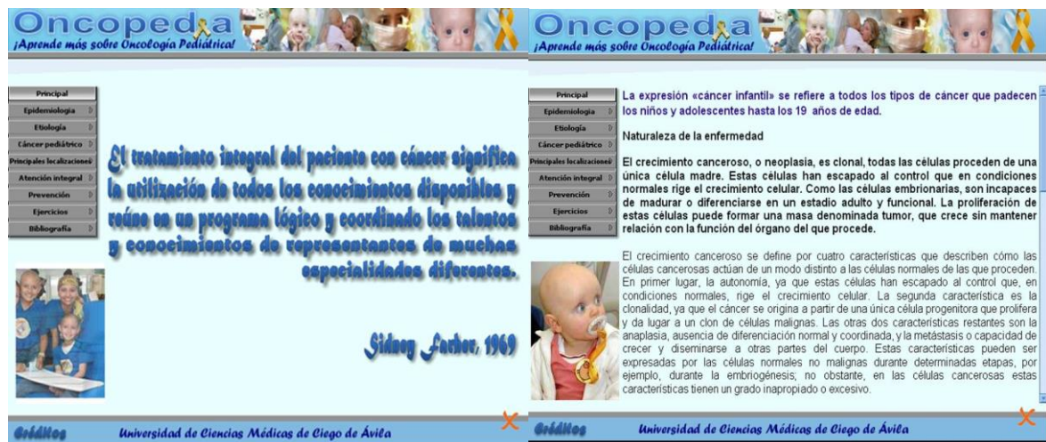
Figura 2. Páginas de contenido del software educativo "Oncopedia".